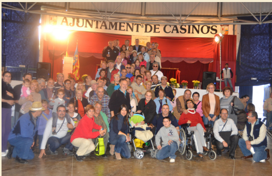
KEDADA EN CASINOS