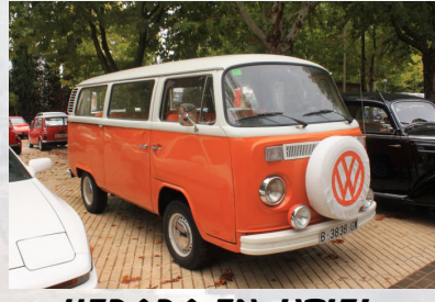
KEDADA EN UTIEL